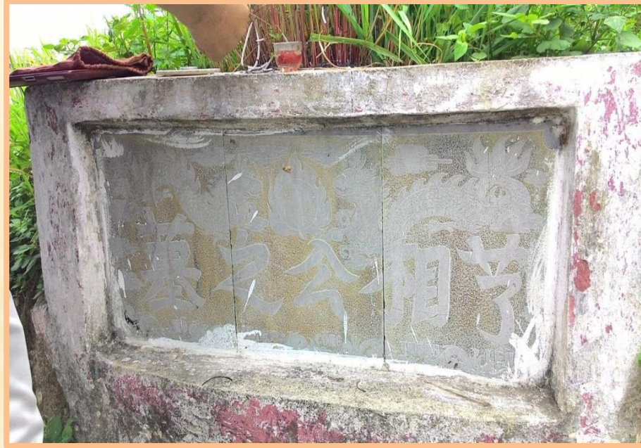
墓之公相芋 - Lều Tướng Công Chi Mộ