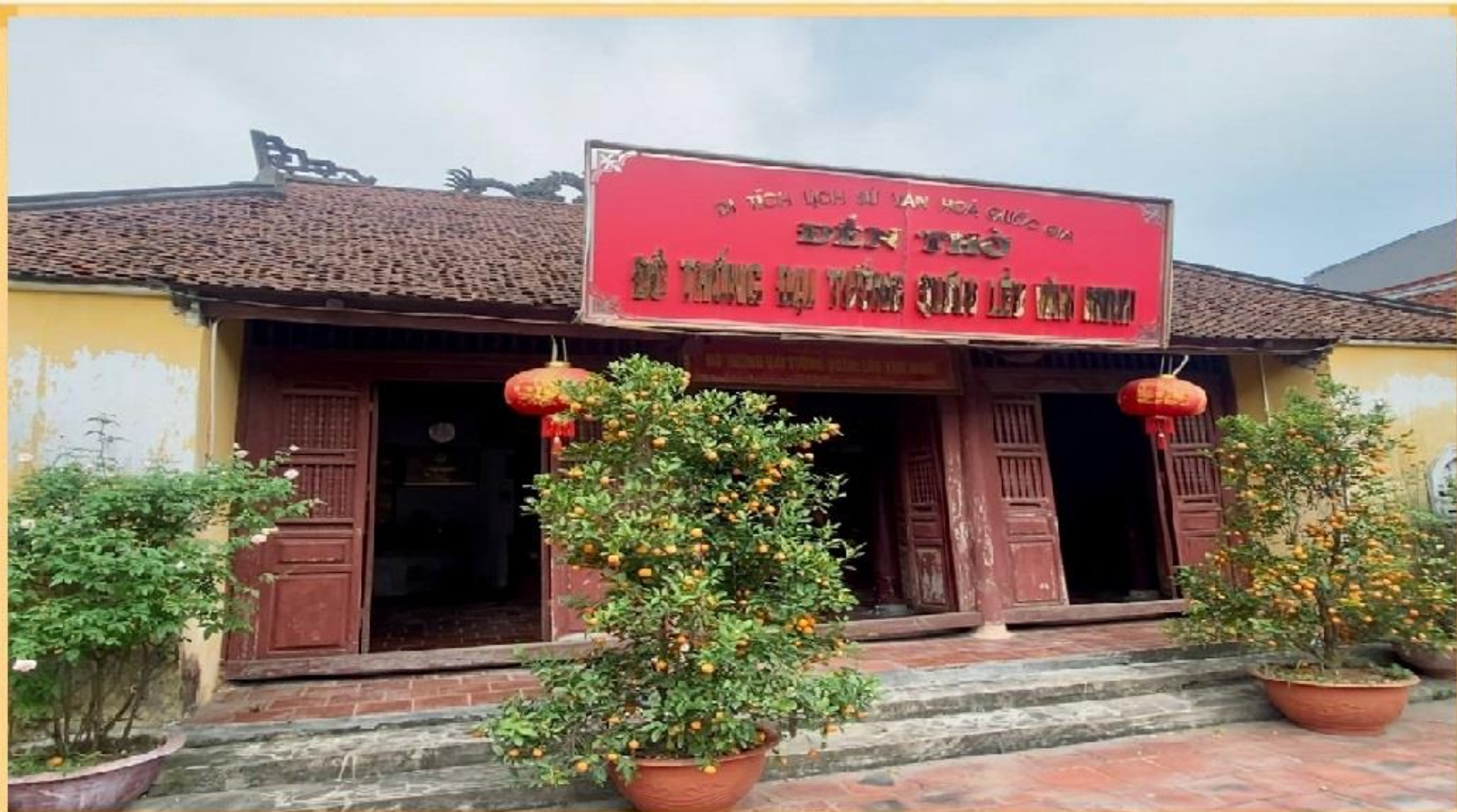
DI TÍCH LỊCH SỬ, VĂN HOÁ CẤP QUỐC GIA ĐỀN THỜ TƯỚNG QUÂN LÊ VĂN MINH